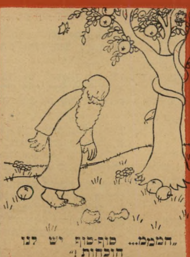
"הממל... סוף-סוף יש לנו הוכחות!"