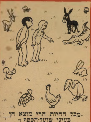
"מכאן החיות חרו מוצא חן בעיני שועל-הכסף!"