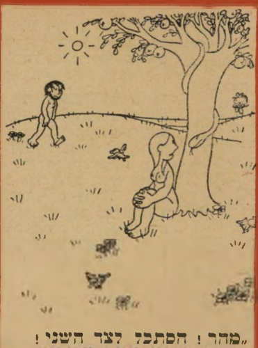
"מהר! הסתנה לצד השני! עשה פנימי איך כסודי!"