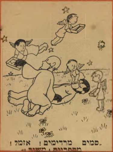
"סמים מרדימים! אזמל! מספרנים! משנה!"