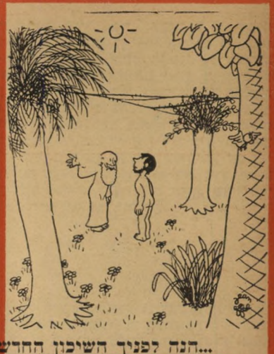
"הנה לפניך השמימי החדש מרום נשעים ועלי שמימי..."