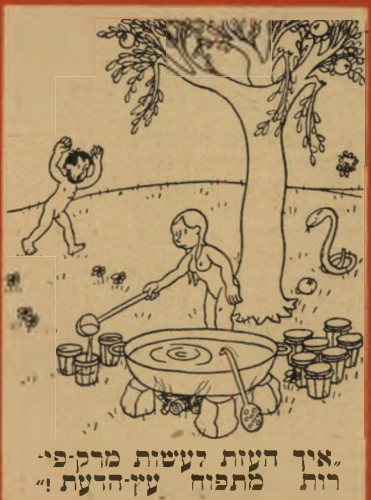
"איך העזת לעשות מדק-פי- רות מתפוח עץ-הדעת!"