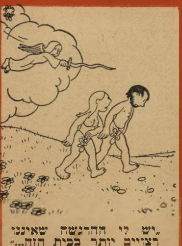
"יש לי ההרגשה שאיננו רצויים יותר בבית הזה..."