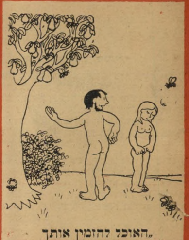
"האנוני להזמין אותך לארוחת-הערב!"

עם מלאת 5714 שנה מיום היווסד כדור הארץ בעזרתו הניבחת, מן הראוי שגם אדם יזכור בתחילת הענין. "העולם הזה" מגיש בזה פרקים נבחרים מקורות אנא ואמא, פרו עשו של קאריק טוריסט צרפתי מפורסם, ומסב את השומת-הלב במיוחד למוסר ההשכל החינוכי. מי יתן והלקח הגדול של אדם ומים גורלים לא יישנה עליהם צאצאיהם של אדם וחווה.