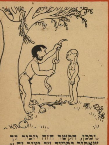
"ובכך, הקשר הזה יזכיר לך שאסור לסמוך על יצור זה!"