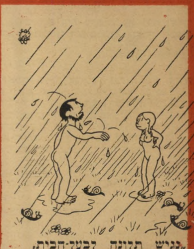
"כניש תלונה לבקר-הבית, הגג דומה!"