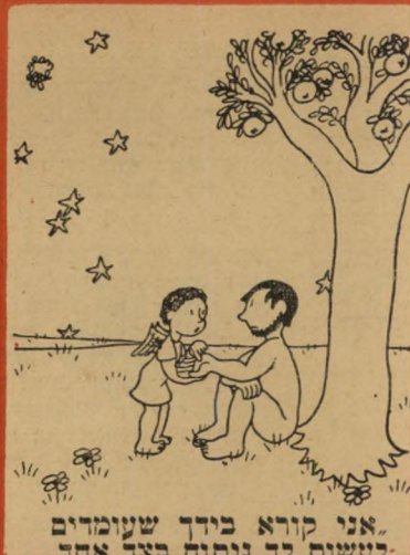
"אני קורא בדרך שעומדים לעשות יד נעמה מאז אדם"