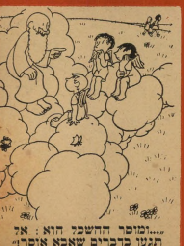
"...ומוסר ההשכל הוא: אל תגעו בדברים שאנא אסור!"