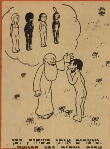
"מועדים אותך בשחור, לבן אדם וצורה יפה ודומה"