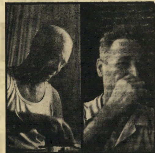
נפתים סיטנר ופסילוב "מדוע?"

אחר באה מהלומה השנייה: הרב הטוניסי, רבי מיימון נת-