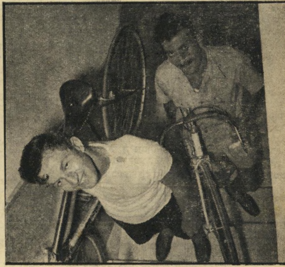
אופננים איתני וטנגסקי הגומי הלך, נשאר הברזל

גולת-הכותרת של המשחים היתה, ללא ספק, השיא בשחיית-חותרה ל-400 מטרים, בו עבר השחיין מגדלבוים את הזמן הקודם של עצמו. הגיע לזמן מצויין של 5 דקות 15,8 שניות. אולם גיבור משחי האליפות היתה חבר גבעתיים-ראובן שנפר, ששבר שלושה שיאים ארציים בשחיית-חזה ופרפר, ושיא אחד של משחי-נוער. הזמנים שלו היו: ● 100 מטרים שחיית חזה: דקה אחת, 29,1 שניות. השיא הקודם, דקה אחת 29,1