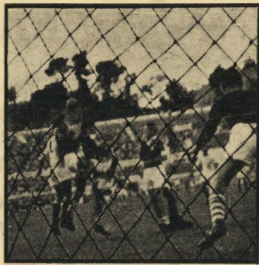
מכה חופשית: מכבי מגן חצי-מיליון דולאר

הטוב בשחקני מכבי היה גלור, אך במשך כל המחצית השניה לא היה לו ממי לקבל כדור ולמי למסור כדור. שניים מן האר' טלקים שמרו עליו בשבע עיניים ולא משו