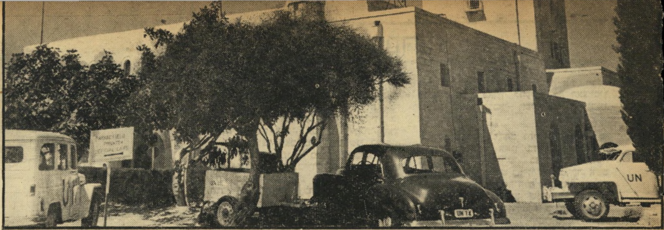
ארמון הנציב בירושלים מפצע-נצק, כמה טיפות של דם