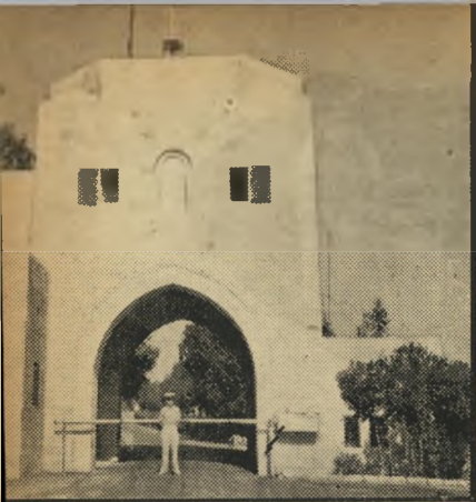
הכניסה לארמון מוצר ישראל על הצלחות, אותיות אנגליות