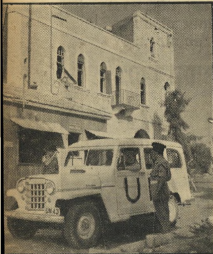
ברסלוי בשער מנדלבום בשדה, קופסאות סיגריות