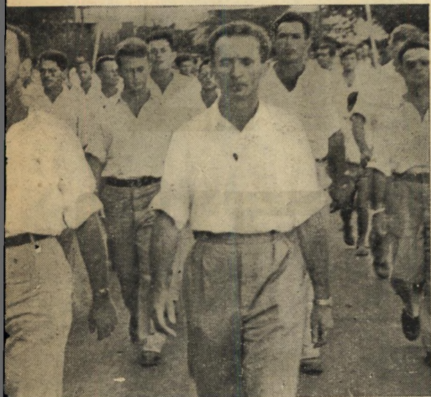
יצחק שדה וישראל גלילי בשורה הראשונה של מצעיד הפלמ"ח הגדול בתל-אביב בשנת 1949. יורמי שדה (התמונה הגדולה מימין) עם אביו לפני

"הוא האדם היחיד במדינה מתחת לגיל 50 העשוי מן החומר ממנו קורצו ראשי-ממשלה!" אמר עליו, לא מכבר, מנהיג