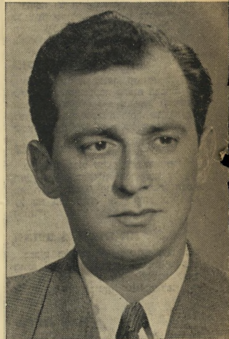
זה עובר השתתפות במלחמה נגד היהודים

אני השתתפתי בהפגנות תל-אביב. הרגנו אלפי יהודים והרסנו את כל העיר.