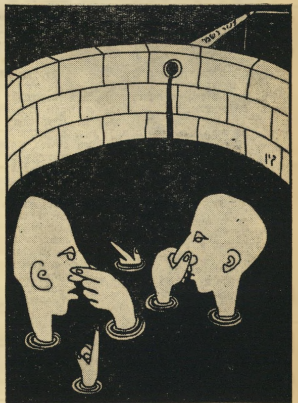
זה באמת מסריח, אבל למה לכתוב על זה?