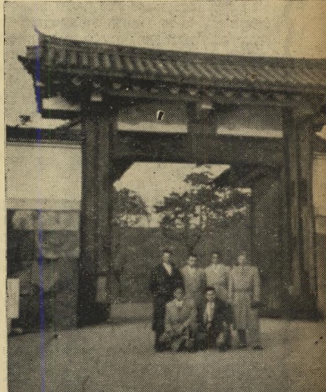
כניסה. שער-אירמונו של הקיסר הירוהיטו בסוקו, ים, אין עליהם שמירה ובכל זאת אין איש מעז לעבדם: יפאנית עתיקה אומרת כי הפולש לתחום הקיסר, יחלה.