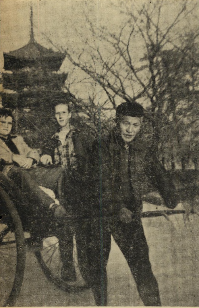
אני רוכב - אתה רוכב. החברה למדו את אמנות הרכיבה עוד בילדותם, חלודה. אחריכך רכבו עליהם המורים בבית-הספר, המדריכים בתנועת-הנוער והק עליהם רבי-החובל וקצין-האנייה. עכשו יש גם להם הזדמנות לרכב על מישהו. הרי רק דבר אחד בלבד: עליו לרוץ, כאשר מצוים עליו, לעצור, כאשר מצוים על

ירושלים של יפאן. העיר מלאה וגדושה במקדשי דת-שינטו. אלפי עולי-רגל כורעים בחרדת קודש באולמות-התפילה העני קיים, כגנים אשר מסכיב למקדשים מתהלכות איילות קדושות, אשר אינן יראות מבני אדם.