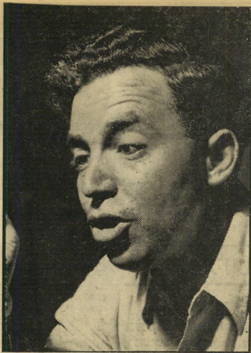
"החידון המוסיקאלי" התשיעית?

אולם לא עבר זמן רב והוא נאלץ לעזוב את הרדיו. הוא עזב את המקצוע האהוב עליו דווקא בשעה שהחל להיווצר גרעין מעולה של אנשי-רדיו צעירים: שמואל רוזן, חגי