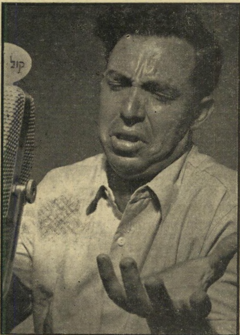
"אשרי המאזין" התשיעית!