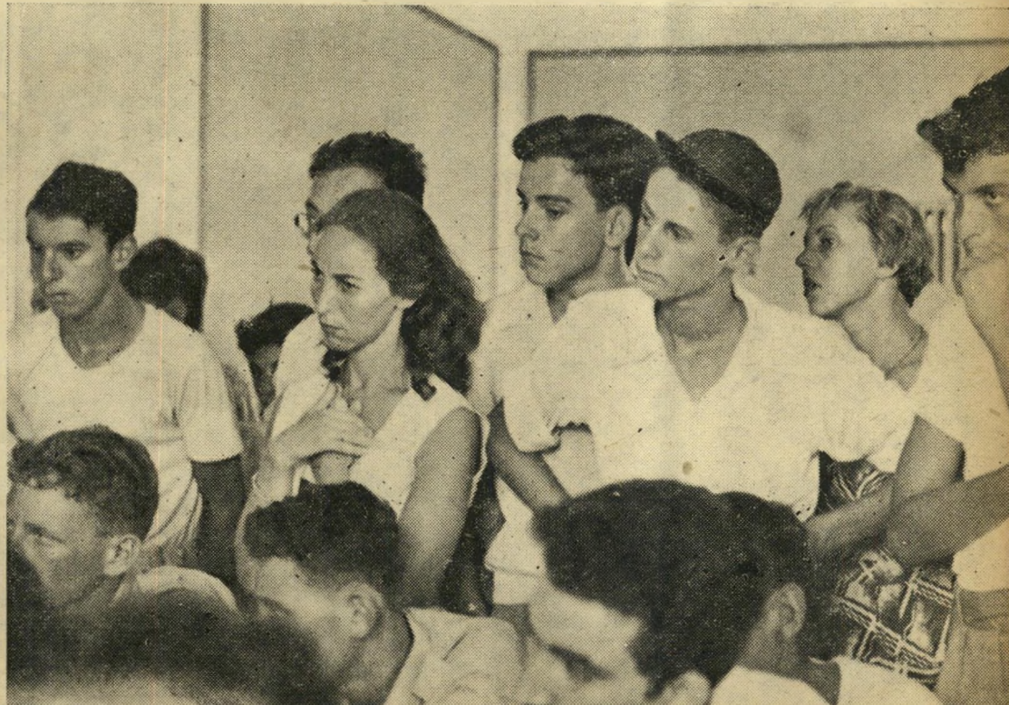
מוכח לזינוק עוקב עורך-הדין שצ'ופק אחרי העדות.