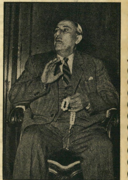
אדיקואטלי באיכסנדריה קרוב לעניבת התלין

הוא קנה לו ווילה גדולה, בת קומותיים ברובע גלימיו" פולוס — רובע הקיסנות של אלכסנדריה — דאג לכך