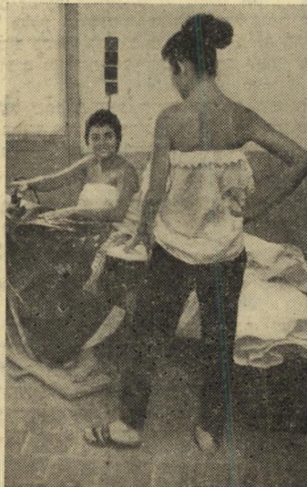
קרשיהגיהוץ היו מוקפים צעירות שניסו לשפר את לבושן המלכותי.