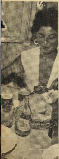
המועמדות נתפת הראיון עם השופטים: