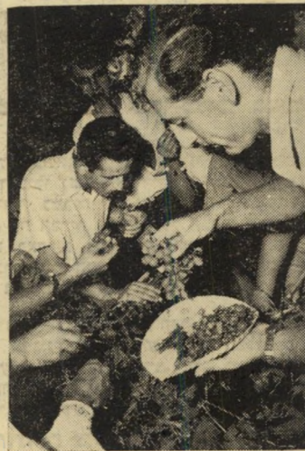
בעקבות ההכתרה הציפו אלפי האורחים את היקב, הסתערו על הענבים.