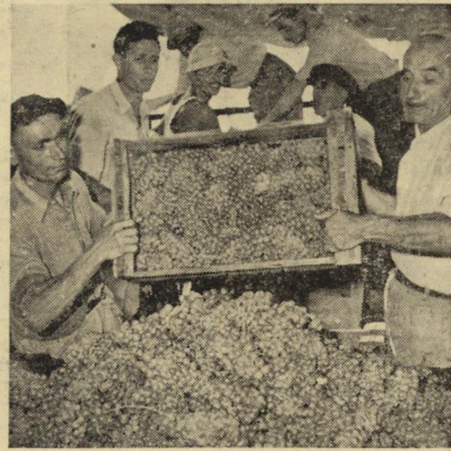
עשרות הפועלים העובדים ביקב המשיכו בהובלת ה"ענבים אל המסחטות, נתפנו רק לעת ערב להשתתף בחג.