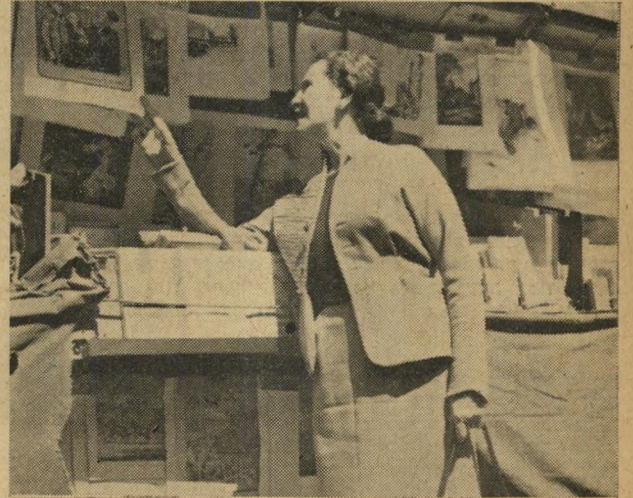
קוסמופוליטית: המ'פגש בין שחקני ישראל וכוש.