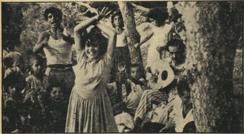
קהל חוגגים נוצרי בחורשת מערת אליהו

לכבוד היום חגג גם בניין סטאלה מאריס, מיסודו של קולג' נוצרי, שבחלונותיו הוד"לקו אלפי נרות קטנים שהאירו לעבר הפתח של המערה, דרכו עברה תנועת גברים ונ"שים ללא הרף. אלה נחפזו לפסל אליהו ב"מעמקי המערה, ניגבוהו במספתחם, אותה