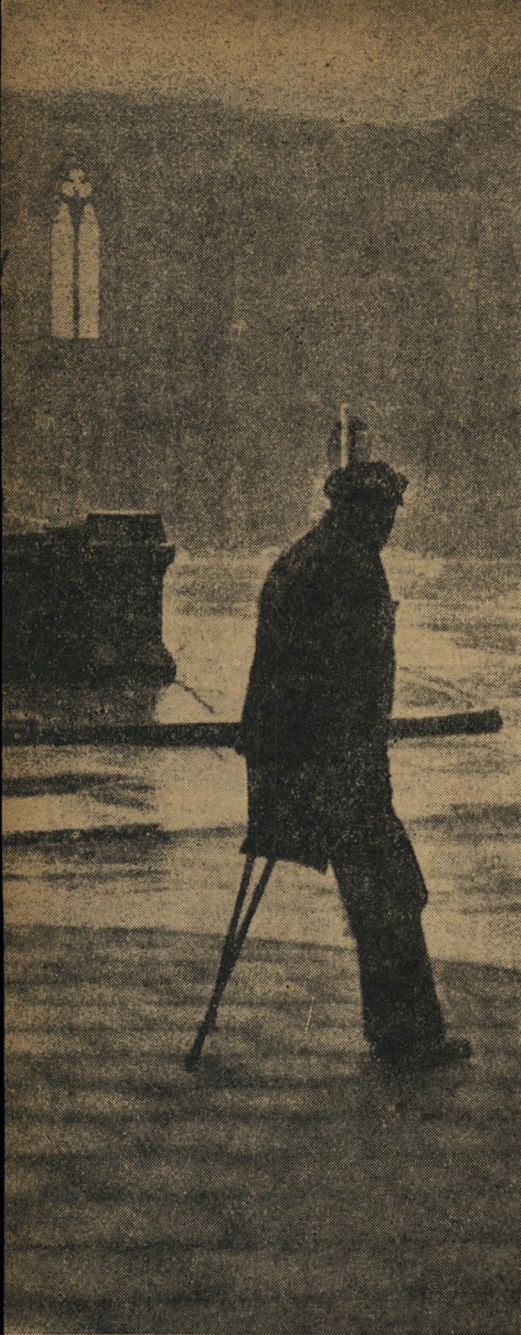
בכל מקום בגרמניה אפשר לראות את מאות אלפי הנכים שאיבדו את אבריהם בתריסר ארצות. עוד לפני שש שנים לא רצה אף גרמני לחזור למדינה.