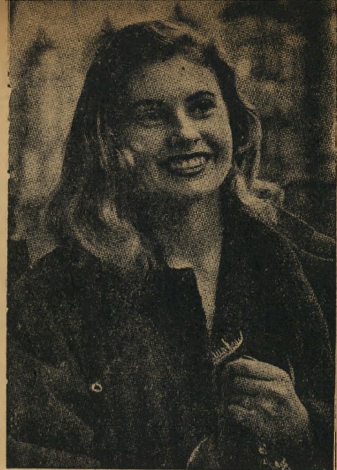
מכל זה לא נשאר כיום זכר: גרמניה היא עתה כשביעתיצון בתערוכה תעשייתית. סמל אחר היא במרכז) — בו נאם היסלר את נאומיו הראשונים.

לא תהיה זאת החלטה קלה. כי מאות אלפי אזרחי ישראל יוכרו את המגפיים הצועדים, את שריריהם המתנגנים. הם יוכרו גם לאן הובילו — בעקם האחרונה.