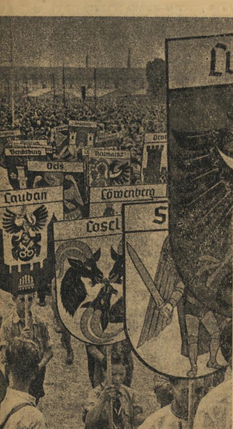
זוהי השאלה הגדולה המנקרת במוחם של מדינאי המערב. הצבא הגרמני החדש עלול לקום ביום מן הימים ולפנות נגד מקימיו, לכרות ברית עם הרוסים (הנראים בתמונה מימין בקירקס ברלינאי, במקומות הכבוד). והוא עלול גם לפתוח במסע צלב כדי צעירים גרמניים בהפגנת נקט.