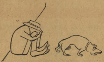
שן תחת שן