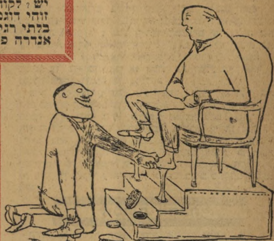
"הג שמח, אדוני, הג שמח!"