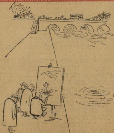
האמנות טעף הזנ