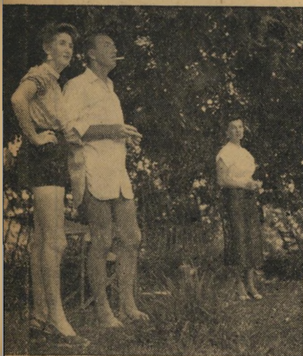
הניצבים: שניים מבין המאות שהופיעו בגבעה 24 כניצבים. תפקידם היה לשכשך כמה דקות בברירת השחייה רחבת הידיים.