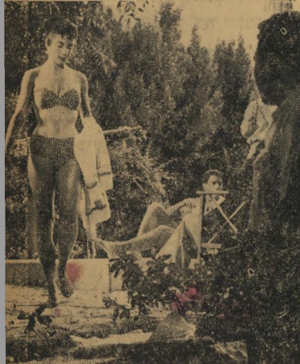
זיווה: לניצבת זיווה היה תפקיד לא-רשמי: כל פעם שקפצה לבריכה, עוודה את השחקנים המיועדים, היסחה דעתם לשניות מספר.

פיטר פריי, מבמאי הקאמרי, סבר אחרת, הזמין החורף את חייה למבחן סרטים אצל חברת זיקאור שהתעתדה להסריט סרט עלילתי ישראלי, המתרחש בימי מלחמת העצמאות, גבעה 24 איננה טונה.