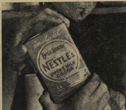
שלב שני. אין זו פרסומת לקקאו נסטל. פשוט, הקופסה הריקה היחידה שהתאימה למטרה זו. החריץ עשוי באיזמל.