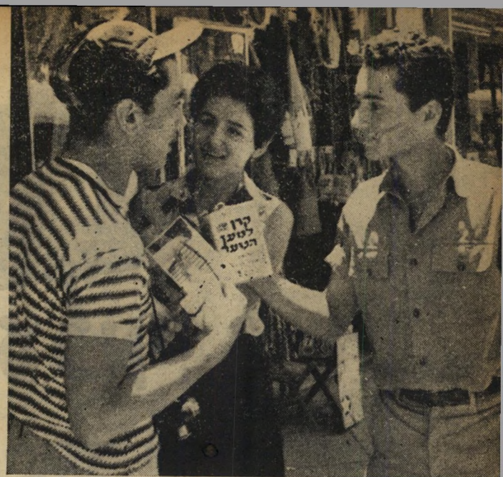
האחד שסרב. "תרמתי כבר חמש פעמים," בתרוץ הנצחי עממי זה ניסה להפטר מסרדנותי אדם זה. למרות שידעתי כי אין אמת בפיו.