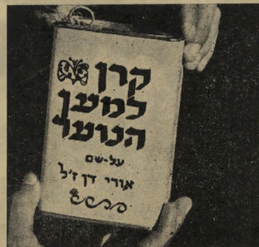
שלב שלישי. אותה גברת בשינוי אדרת. כדי שלא ירננו כי אני שואל קופסאותי מחברת קקאו עספונה בעטיפה מהודרת.