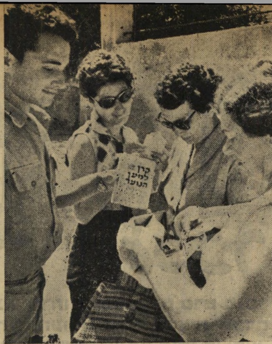
השתיים שנתנו. בני אדם אחרים נפטרו רק כששלמו כופר נפש. "פעמיים, בבקשה", אמרה אחת מנשיא אלה.