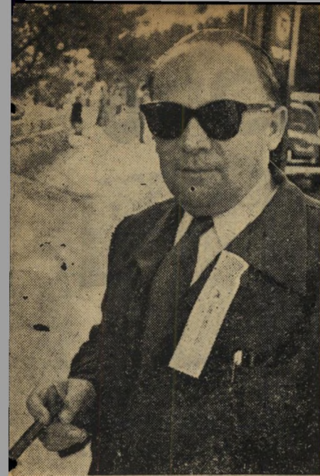
האחד שהתגאה. אדם זה הציג ב" גאוה את הסרט הענוד מול המצלמה.