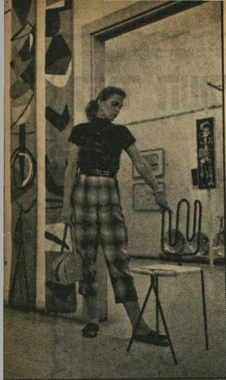
מבקרת עם כסא והדפסת טכסטיל — במקום קערות שושנים ורהיטי מלאכים —

* גם בזכות ספרים מכילים תיאורי אור"גיות מיניות על כל פרטיהן.