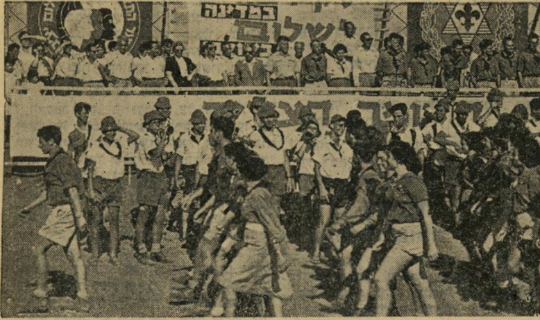
השומר הצעיר: יערי במסדר התנועה החינוכית

המפלגה השלישית בגודלה במדינה עמדה, השבוע, לפני פירוק סופי. רק דחיה ברגע האחרון הצילה את המצב לשבועיים. כמו תמיד במקרה כזה, ניסה כל צד להטיל את האחריות על הצד השני ליצור, אגדה של אשמה שיוכיח כי יריבו לבדו גרם להתנהגותו המחפירה לפילוג.