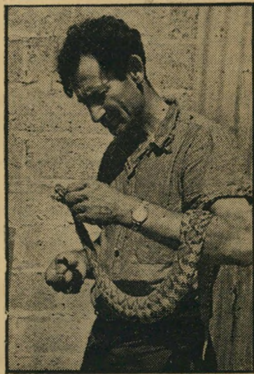
צייד נחשים מן וצפע זוג נעלים + 3 ארנבות

● שפירא האשים אותי שאני מקבל כסף האמריקאים. אני מקוה שחבר"הכנסת