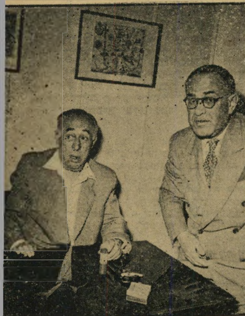
אריאב ורוקח מרות בראש