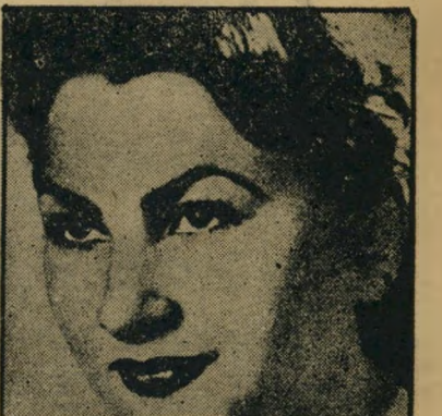
קרבת רצח מונטאזי

העיתונאים האיטלקיים ידעו על אי התאמת מות אלה. אך הם לא התחשבו בכך עד כמה לא התקבל הסבר זה על הדעת. הם שתקו. לא שתקו - סילבאנו מוטו, עיתונאי ניאורטיסטי שחיפש פרסומת לשבועונו החדש אטואליטה (החדשות השועי). הוא החליט לחקור פרשה זאת לא רק מפני שהיתה חשובה למדי, אלא גם מפני שנתנה אפשרות נוחה לתקוף את פרקליט המחוז של רומא, סאבריו פולטי, לו טרם סלהו הפשטים את חלקו במאסר מוסוליני. כתבתו של מוטו, שפורסמה באוקטובר 1953, הביאה אותו לפני בית המשפט ב-