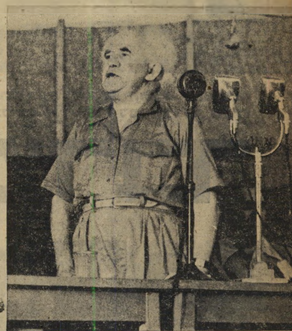
- נאם - בני חיפה אלה הקשיבו בדומיה לנאום, אף שלא הבינו מה זה "נונקופורמיזם" ולא התענינו בתורות הבודהא. חבריהם התליאביביים, בצד השני של האמפיטיאטרון, היו פחות אדיבים, צחקו ורעשו ללא הרף.