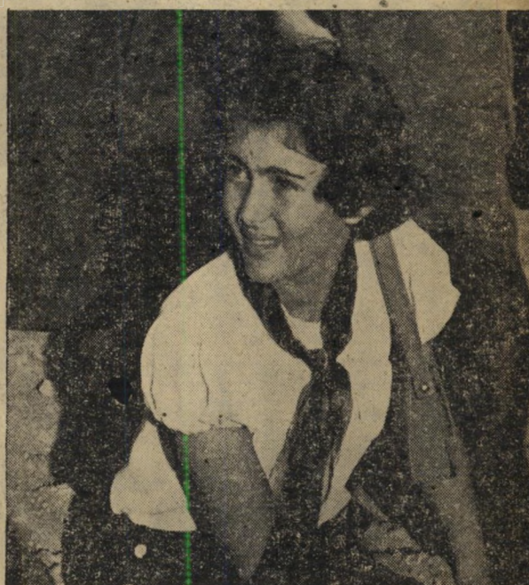
- והלך - הנאום נגמר. מלווה על ידי זלמן ארן ניגש בן-גוריון למכונית. באותו רגע כבר ידעו שני הצדדים כי המיפגש חגדול לא הצליח. בן-גוריון לא מצא את הדרך אל לב הנוער, הנוער לא חש כי עבר חוויה גדולה.