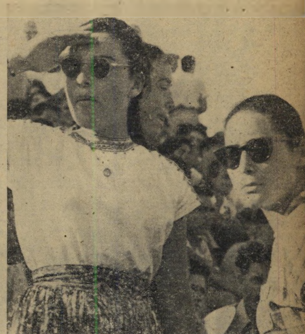
בני ג'י. בא - שתי צעירות אלה דאר אותו זו הפעם הראשונה בחייהן. אפילו מרחוק נראה עיף, נשען בכבוד על מקל תוך כדי הליכה. קשה היה לתארן כסנהיג ההולך לפני המחנה לקראת מיבצעים חלוציים.