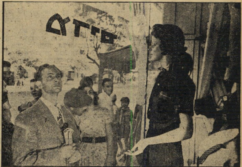
1 אגדה מופלאה נספרה, סיפור כה נוגה ועצוב, על יצור-שעווה כלי-היופי, ועל עלם-החן האהוב. היא עמדה בחלון והביטה, אל העלם שלחה המבט — היא עמדה בחלון לדא-נוע, אך לב-גבם נפעם ונצבט.

ומוסר והשכל לבני-נוער, כי שולטת בכל אהבה: בפיל. בלגיא וברמש