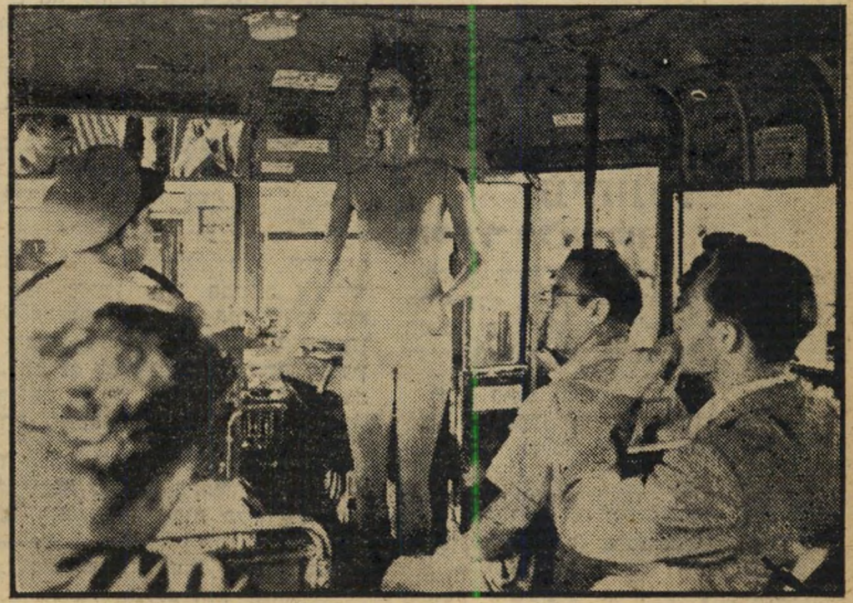
9 בלי תור הוא קפץ אל הולדת, עלה וישב במכונית, לנהג התחנן: "נא, מהרה! רודפת אחרי אדמונית!" הנהג המנוע התניע: "לדרך!" — אבוי, מאוחר — (אהבה כנפים תצמיח) היא היתח במכונית מכבר.