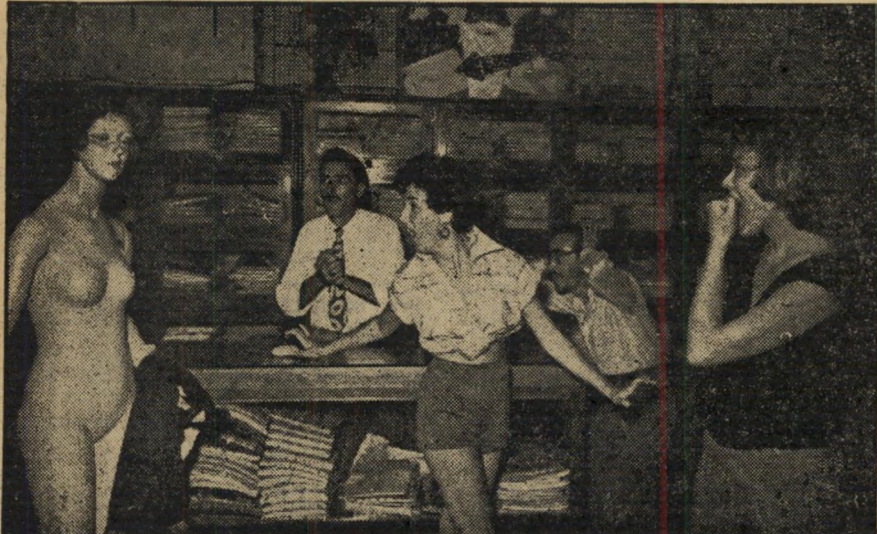
2 כאותה גאלאתיאה בת-קדם לתחינת פיגמליון האוהב, יצאה מתצוגת הפירסומת, והלכה אחרי צו הלב. לדיי הזבן, איש-הסחר, זרקה את שמלות הפאר — היא נטשה את מקום מגוריה, את אורות החלון הזוהר.