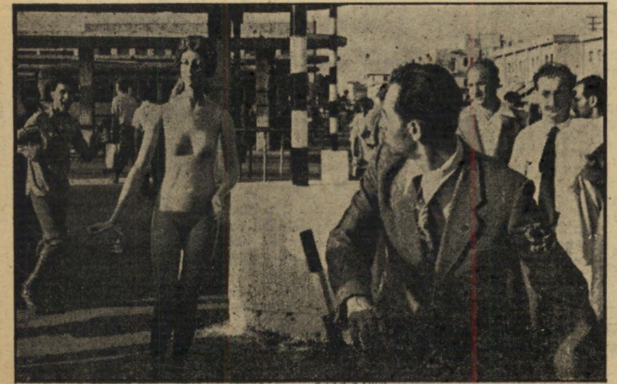
10 המסע אל קיצו כאן הגיע, הם ירדו, זה בצד זה, להמשיך במנוסה ובררף, לתרועות ההמון העולזות. אוטובוסים שרצו שם כאלף, הפיצו ריחות של בנוין. אך מה לבוכה זלאתה: לא תיטה היא לשמאל וימין.