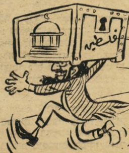
של או"ם: מפתח הארגון (פלסטין) בידי הליגה הערבית.

יחסה של הליגה ל' ישראל זוהי לבי' קורת קטלנית. קשה להבין כיצד שבע מ' דינות גדולות וחז' קות אינן יכולות ל' התגבר על עם קטן, שאין לו כל בסיס י' ציב. לליגה הערבית יש כל הדרוש כדי לחסל את ישראל — חסרי לה רק הרצון והיכולת להתגבר על הריב הפנימי.