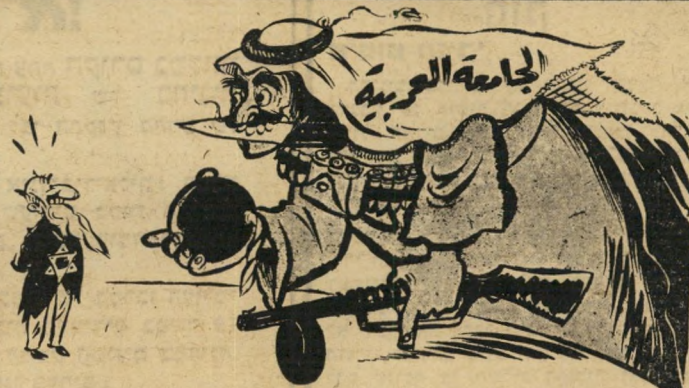
הליגה לוישראל: יש לך מזל. ידי הימנית עסוקה. שינוי אינן פנויות. גם ידי השמאלית עסוקה. איך אתה רוצה שארביץ לך?

יחסה של הליגה ל' ישראל זוהי לבי' קורת קטלנית. קשה להבין כיצד שבע מ' דינות גדולות וחז' קות אינן יכולות ל' התגבר על עם קטן, שאין לו כל בסיס י' ציב. לליגה הערבית יש כל הדרוש כדי לחסל את ישראל — חסרי לה רק הרצון והיכולת להתגבר על הריב הפנימי.