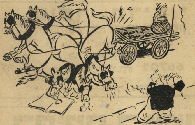
"בעצבם, מה אשמתו של העגלון? הסוסים הם חמורים!"

יתכן כי אין האשם בליגה הערבית כמסוד, כי אם בחבריה, אילו היו לה מנהיגים אחרים, טובים יותר, יתכן כי בכל זאת היתה מצליחה להגיע רחוק.