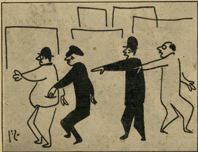
"הוא לא נגב! הוא קרבן לתככים פוליטיים!"