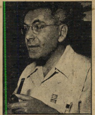
הדברים הבאים נמסרו לכתב העיר למ הזה עלידי פרופסור יצחק ברנר בלום, ראש המחלקה לביולוגיה ניסיונית במכון ויצמן למדע, ואחד מן חוקרי הסרטן הידועים בעולם.

רידס דינג'סט. הירחון הנחשב לאחד מגור"מי"ההשפעה החזקים ביותר בארצות הברית (תפוצתו: 17½ מיליון טפסים), פתח בהתקפה רבתה על העישון. הוא פירסם תוצאות של מחקרים מדעיים, הוכיח כי מתוך 100 מעשנים מושבעים 46 בלבד מגיעים לגיל 60 בעוד שמספר המעשנים הקלים הוא 61 והלא מעשנים 66. מתוך זה, הסיק הירחון, מסתבר כי כל אדם המגיע לתוצאות יומית של 20 סיגריות מקצר את חייו ב"34 דקות עם כל סיגריה שהוא מעשן או בחמשה חודשים, 22 יום, שמונה שעות וארבעים דקה מתוך כל שנה שהוא מעשן.