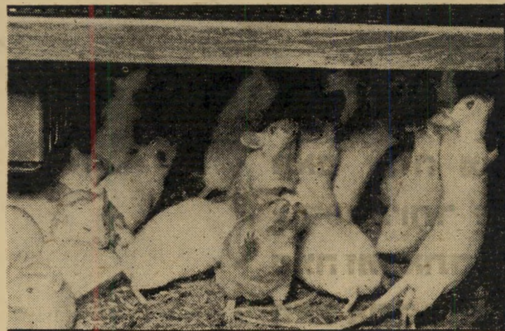
כדי לנסות את השפעת עשן הסיגריות על עכברי-הנסיון, מוזרם עשן אל תוך הכלוב והסוכרים חייבים לנשמו. עד כה לא הראו עכברי-הנסיון כל סימנים של נגיעה מן העשן.

נשאלת השאלה באיזו מידה עליית סרטן-הריאות היא אמנם עליה מעשית. כא"ן התפתח חקר הסרטן, נרשמה עליה גדולה מאוד במספר המקרים. אולם זאת היתה עליה סטטיסטית בלבד — כלומר שהמקרים שנרשמו לא היו מקרים חדשים, כי אם מקרים שהשיטות המפותחות יותר אפשרו להבחין בהם. גורם אחר לעליה זו היה הארכת החיים, שהביאה בעקבותיה ריבוי מקרי הסרטן. אולם ריבוי מקרי סרטן-הריאות היה גדול בהרבה מזה של מקרי סרטן אחרים. היה ברור כי אין כאן עניין של עליה סטטיסטית. לכן החלו לחקור את הדבר