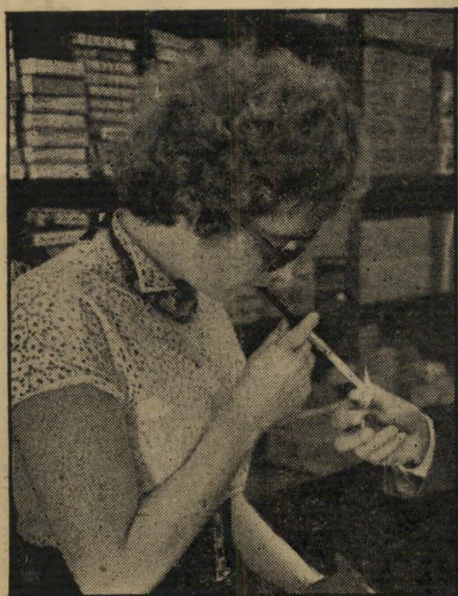
מעשנת זו קראה על סכנת סרטן הריאות החבויה בעשן הסיגריות. אולם מאחר שלא יכלה להפסיק לעשן (למעלה משגרים ליום) ביקשה להיעזר באחד האמצעים השונים שהוצאו לשוק. בתוך הפייה שלה הכניסה מסננת, המכילה חומר כימי מיוחד. אולם חומר זה טוב לעצירת הניקוטין בלבד, אינו פועל נגד הזפת שבתוך עשן הסיגריות והגורם, לדברי המומחים, להתפתחות סרטן הריאות. השימוש בפייה אף הוא נחשב לאמצעי מיניעה מסוים, כי חלק משיירי העשן נדבק לפנותיה בדרך אל הפה. אך הפשן בכל זאת חודר לריאות, משתקשש שם. עם כל סיגריה נוספת, נולדה כמות החומרים המזיקים, הקרצינוגנים, הנשארת בגוף. וזאת לאט, אך בבטחה.