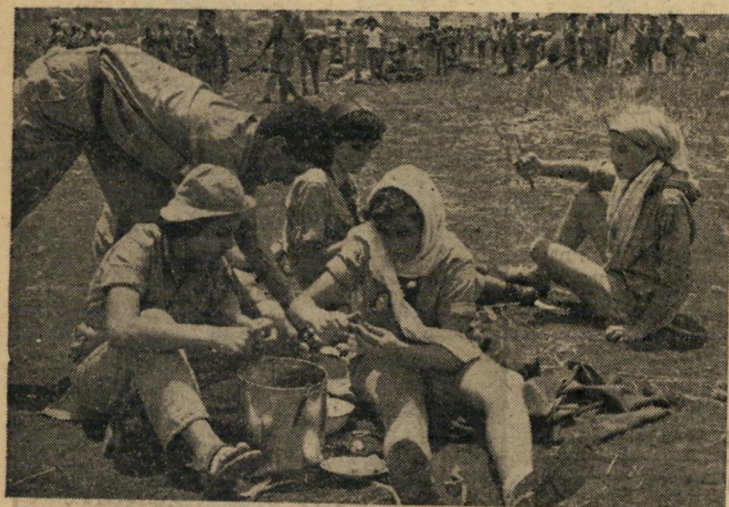
לו הטילה עליהן אמא לבשל ארוחה, היו מתמרדות. אך כאן זהו תנוג ממש— אפילו אם הנסיון לא כל מצליח.

יקוד הדבקה (בלי יבם הנערים ההל ערבים זו הפעם