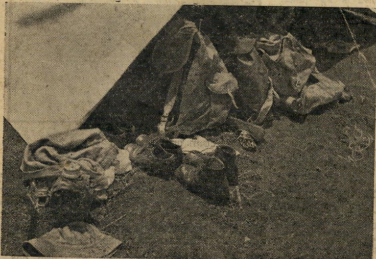
החצוצרה מריעה. צריכים לקום, לכל הרוחות, זה עתה רק הלכו לישון. אך אין דבק— לא בכל יום מתקיים ג'מבורי.