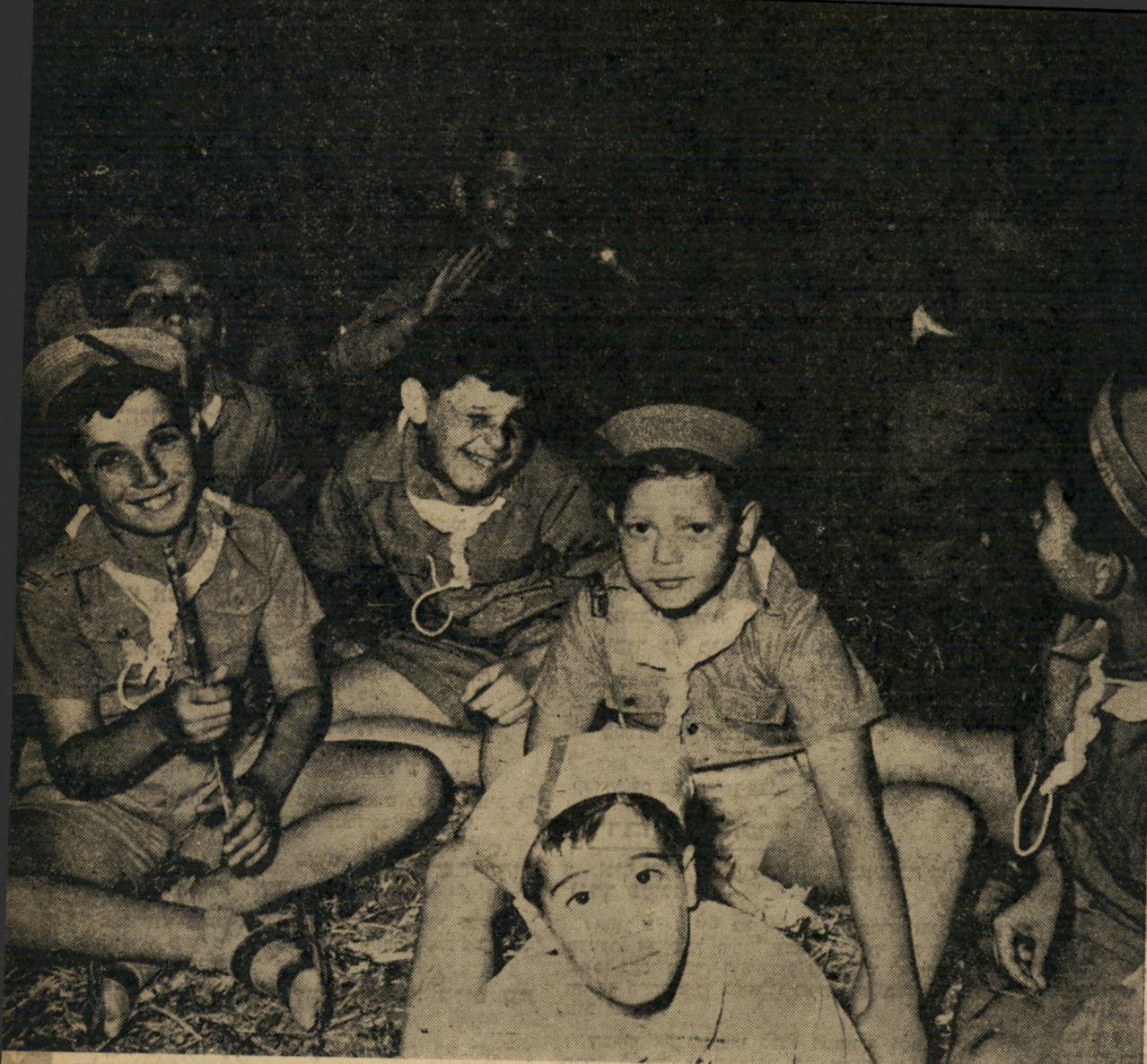
רוב משתתפי הג'מבורי היו ילדי בית-הספר העממי. רבים מהם ישנו זו הפעם הראשונה בחייהם מחוץ לבית. רחוקים מסינור אמא. פרצופים אופייניים אלה שייכים לבני צפון תל-אביב, חברי שבט צופי דיזנגוף.