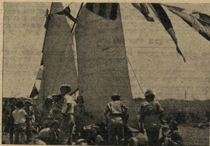
כל שבט ביצע מיבצע משלו. גאות שבט צופי-הים, בחולצותיהם הלבנות, על מערכת המיפרישים השלמה שהקימו בג'מבורי.