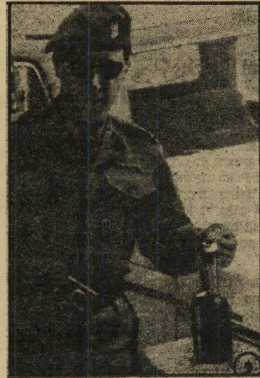
משקיף או״ם ומוצג* בכוח —

במכוניתו הפרטית המשווריינת אל מעבר גבול לבנון, הספיקו יורשיו הכריז הכרונות רב־בות על נושאים רבים. לפני ימים אחדים הח־ליט סופר השבועון רוז אל־יוסוף הקהירי לרכז את ההכרונות במאמר אחד. הוא בחר בפאיד אל־אתאסי, שר החוץ הסורי, ביקש ממנו ראיון מיוחד.