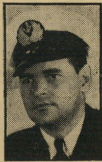
מפקד חיליהים מרדכי לימון.

"בלום פיך. לך לישון. אני מת." "ליל מנוחה." "ליל מנוחה." מישהו נחר קלות.