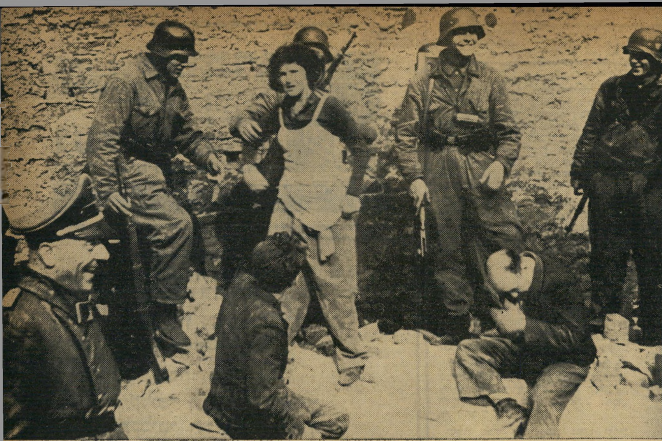
המפקד צחק והחיילים חזרו אחריו. המנצחים אהבו להצטלם עם שבוייהם. עינה האדישה של המצלמה קלטה הכל: את הרובים והקסדות הנוצצות שהפכו את הגרמנים ליצורים עליונים, את מבט היאוש בעיני הלוחמת השבוייה.