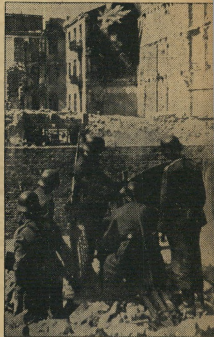
הת תח תותח שדה קל קולע אל המטרה (הפגיעה נראית יפה בבנין).