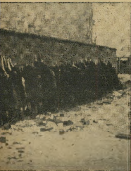
פניהם אל הקיר, ידיהם מורמות. מאחור, אך ליבם שקט ושלוו.

מיליון יושביו 15 אלף שבויים. הכוחות. אכזריות הצרים וועם ו קרב זה דומה לסיפור והקלאס ירושלים על ידי טיטוס. אלא שמו לא נשבה: הוא נפל בשלבי האחר