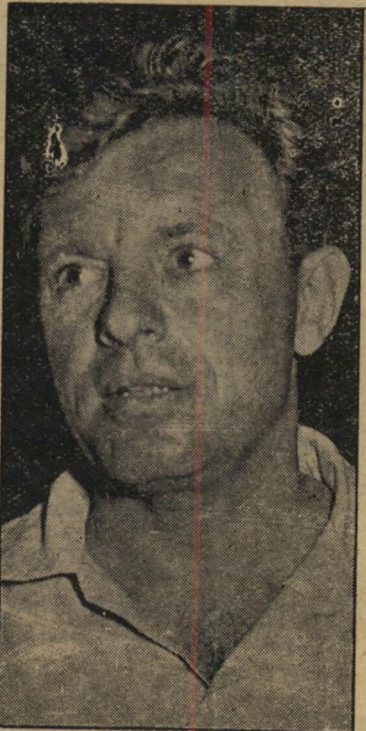
מנהיג-משרד, טרוי קוק

* יגאל אלון אמר: "כשחיילי גיעו לירדן ואני אשב בשכס, אז נחליט מה יהיה גורל האזור הערבי." יערי תבע, לעומת זאת, שצה"ל יכבוש את המשולש כדי להקים בו מדינה ערבית שתחיה קסורה מבחינה כלכלית עם מדינת ישראל. ** יערי אמר, בישיבת מרכז מפ"ם: "לא מספיק שמצביא יהיה איסטראטג גדול. דרוש שיחיה לו גם שכל."