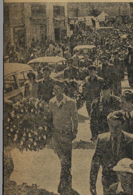
המונים ליוו את הארוונות, שניה שהחוקרים יצאו בעקבות הרוצחים.