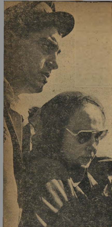
הורים: תמונת יגון קודר, אולם של הורים וקרובים המומים.