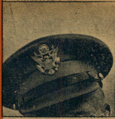
5. מתחת לכובע זה מסתתר: (א) קצין אמריקאי (ב) האדמירל נלסון (ג) שוטר צבאי ישראלי (ד) מכבהאש חיפאי.