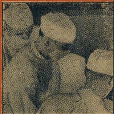
8. חובשי כיסוי זה עוסקים ב: (א) אסיה (ב) ניתוח (ג) רוקחות (ד) חקר אפסמים