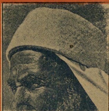
12. זהו כיסוי-ראש של הכם דת: (א) קאתולי (ב) בודהאי (ג) דרוזי (ד) אתאיסטי.