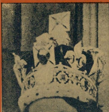
13. כתר זה מסמל את המלכות הקיימת ב: (א) יוגוסלביה (ב) מצרים (ג) פאקיסטאן (ד) בריטניה.