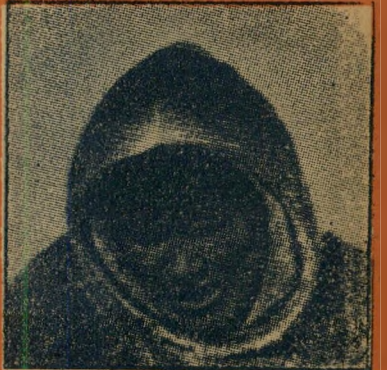
בעל כובע זה נתן את שמו ל: (א) פלאסל (ב) מכוניות קרייזלר (ג) שלדוני אסקימו (ד) מקררי פרינידור