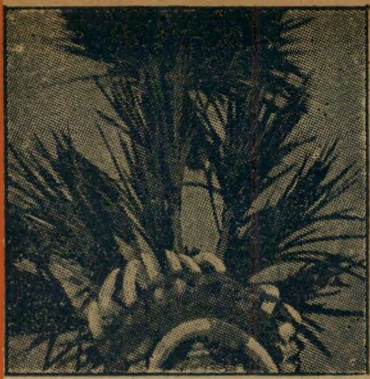
4. דבר פזר זה מקשט את ראשם של: (א) האחים המוסלמים (ב) התורכים הצעירים (ג) בני שבט זולו באפריקה (ד) מרילין מונרו בסרט "רוי".