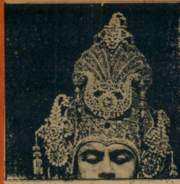
2. כיסוי ראש זה הנו: (א) כתר של מלך ארצות-הכרית (ב) מכשיר עתיק לסילוסול-שער, (ג) קישוטראש של רקנית הודית (ד) כובעה של אינריד ברנמן בסרט "למי צילצלו הפעמונים".