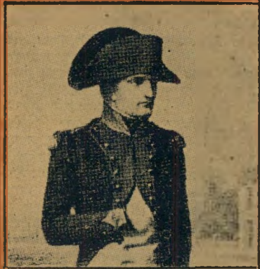
8. כובע זה היה נהוג בתקופה בה הוטבעו המטבעות: (א) דראכמות (ב) נאפוליאונים (ג) פלעים