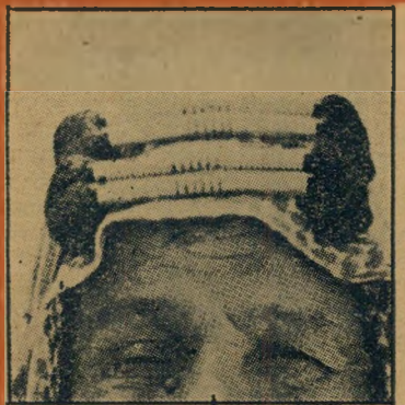
10. העקל של ערבי זה מסמל: (א) שיש לו ארבעה ילדים (ב) שהוא עלה ברנל למכה (ג) שהוא מתלבש לפי האופנה הסודית (ד) שהוא שייך מכוכר