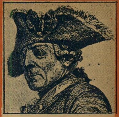
1. כובע זה הנו: (א) כובע ארמירל בצי השווייצר המלכותי (ב) משולש-קצות מימ' פרידריך הנדל (ג) כובע פרטיונים של טיפו (ד) כובעו של המן הרשע, לפיו אופים את אמני-המן.