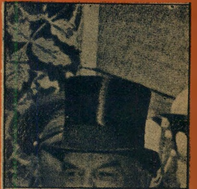
כובע זה הוא חלק של התלבושת המקצועית של: (א) דיפלומטים (ב) מלצרים (ג) בלשים (ד) אופים

זהו הרכיעי והאחרון בסדרת-החידונים. כין הפותרים יוגרלו על ידי שני השופטים הכלתי-תלויים - רואה-השבון דעורד-דין - מערכת הפרסים הבאים: (1) נסיעה לאירופה וחזרה, (2-5) מינויים שנתיים על "העולם הזה" (6-10) מנויים חצרי שנתיים על "העולם הזה" (11-60) תקליטום של חברת "הד ארצי", לפי בחירת הזוכה, (61-100) כרטיסי-תיאטרון זוגיים. הוראות מפורטות למשתתפים, לקראת סיום-התחרות, בעמוד 12 של גליון זה (מדור המודעות). רק תשובה אחת מתוך ארבע היא הנכונה.