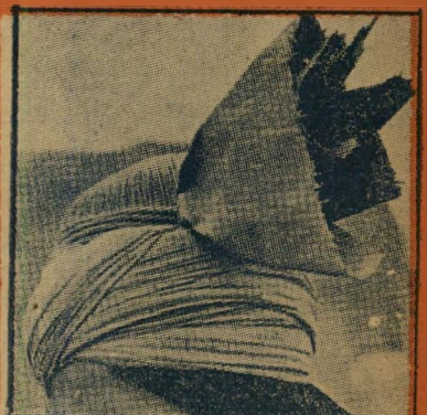
11. כובע צבאי זה הוא: (א) הודי (ב) סובייטי (ג) ארננטיני (ד) יפאני.