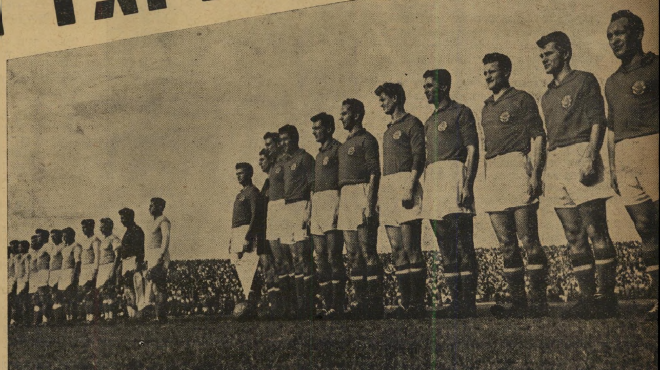
צילוי ההמנונים היוגוסלבי וישראלי זקפו קומת 22 השחקנים. יותר מ"50 אלף צופים הביטו ברעד לעבר 11 האורחים שעמדו, לפי כל המשוער, להפציץ פעמים רבות את השער הישראלי. למרות אי-השוויון הגדול והבולט בין שתי הקבוצות היריבות, קבע רק שער אחד ויחיד את נצחון היוגוסלבים.

ברור היה כי 50 אלף הצופים לא באו לחזות במאבק גומלין. היה זה צלצול מלים יותר מדי מגוחך. הם באו כולם כאחד על מנת לראות את היוגוסלבים עם אלילים כ"בובק, צייקובסקי, מיטיץ ועוד, סקחו את עיניהם לרווחה למראה ההתנגדות העזה של הישראלים. תחילה היו מחיאות הכפיים ני"מוסיות גרידא. זה כלום, מיו יתמלא השק