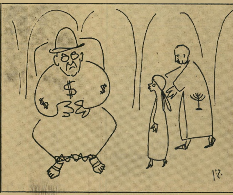
לכי למדך אחשוורוש, הוא יתן לך כסף י'