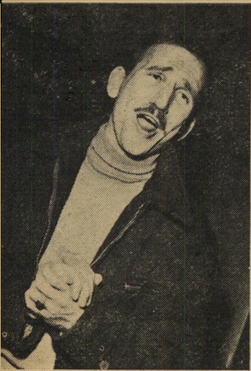
באמת אינני אשם... אצלי הכל הפוך עכשיו. אני כהוגן מאוהב!