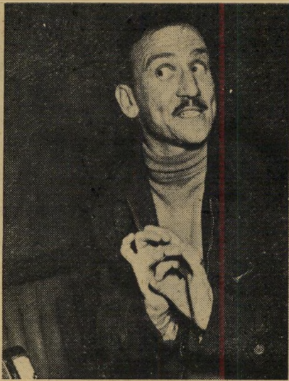
צועד אני כאילו שט במין חלום בולע אספירין למרות שאין לי חום, "לילה טוב" אומר אני תמיד ביום —