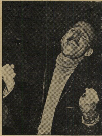
באמת אינני אשם... ואיך זה סוד אצלי עכשיו, אני כהוגן מאוהב!