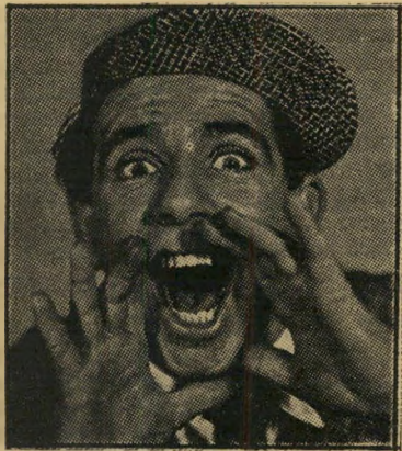
קומיקאי נורמן וויסדום לצ'רלי יורש

אמן אחר, צ'ארלי (אורות הבמה) צ'אפ' לין, נמנר-הקומה ולבן-השיעור, שויתר על נתינותו האמריקאית והשתקע באירופה, הת-