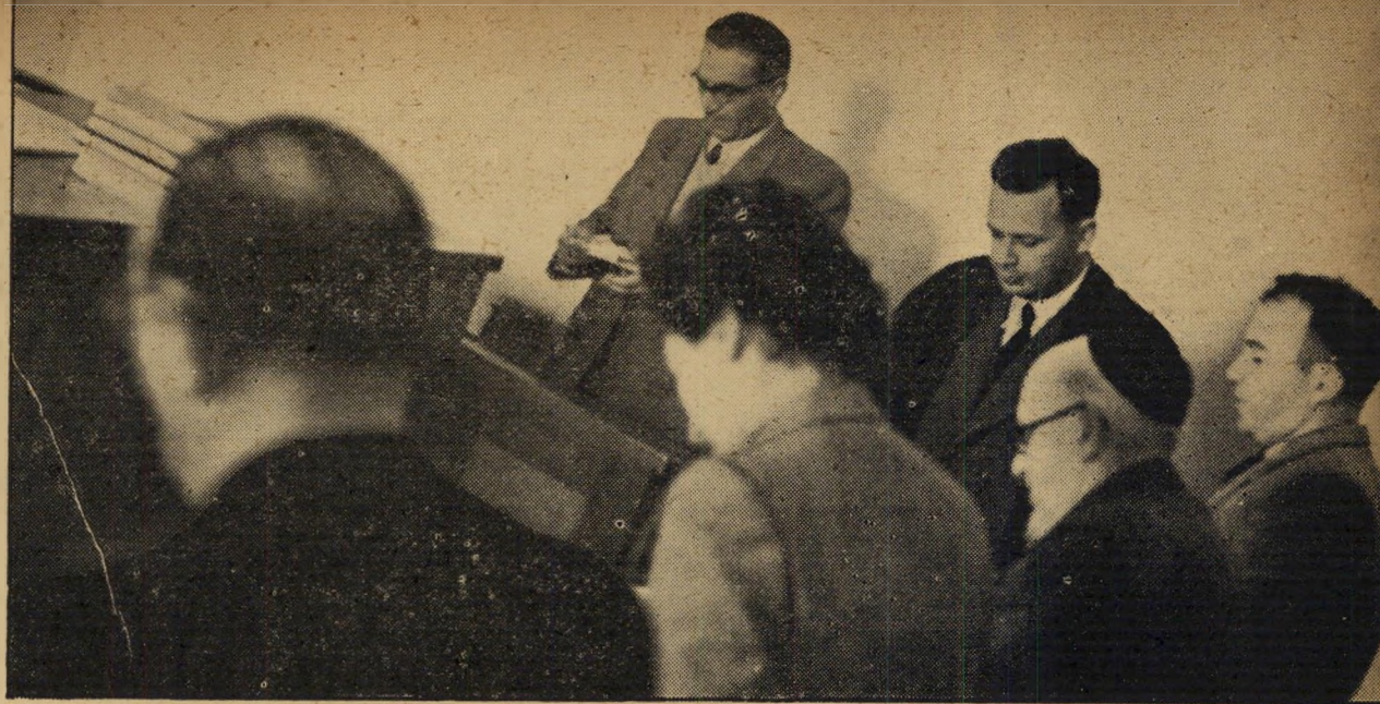
רגע סמלי: תמונה זו צולמה ברגע שנכנס השופט הלוי לאולם בית המשפט וכל הנוכחים קמו על רגליהם, כנהוג. אולם היא נראית כאילו אבליים כל הנוכחים על המליונים, אשר השמדתם היא הרקע האמיתי למשפט זה. האיש הממוסך, הקורא ברשימותיו הוא העד