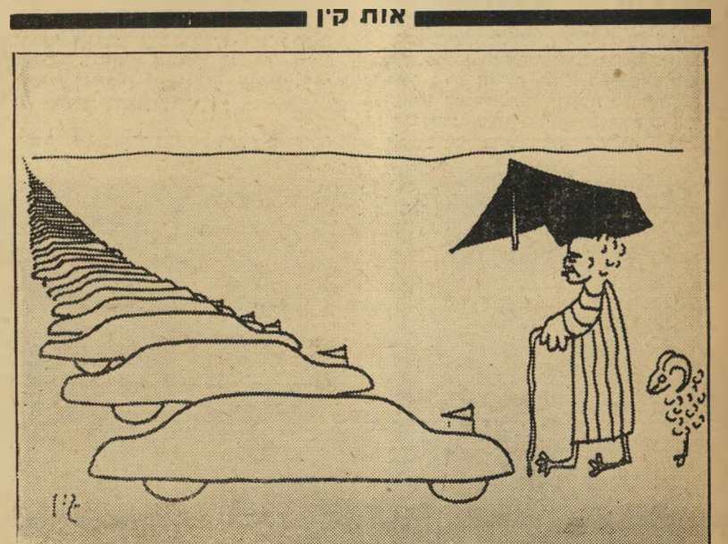
חיי הפרשים בא לשחרר את בני גיי. משרד-הביוקר.

מזג האויר היה גשום. על הכביש המוביל למזבלה העירונית החיפאית ניצב טנדר ירוק ולידו עמדו מספר קציני משטרה בתלבושת כחולה-מצוחצחה כשהם מקיפים ערבי זקן טרוט-ענינים, לבוש בלוי סחבות שענה בכי (המשך בעמוד 12)