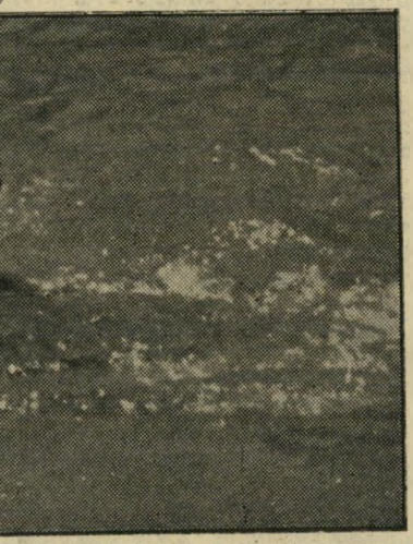
אב שבתאי מזרחי מחפש את בנו כמוצריה... אני רוצה כבר לנחו!

שבתאי מזרחי (31), לא היסט, רץ לכיוון החאדי, לא מצא סימן וזכר לבנו. סיפר יוסף: יעקב הלך על שפת החאדי, ראה פרח אדום בקרבת המים, מיהר לקטפו, התחלק בכונץ