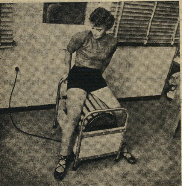
רכיבה על סוס השמלי, לחיטוב החלק האחורי של הגוף.