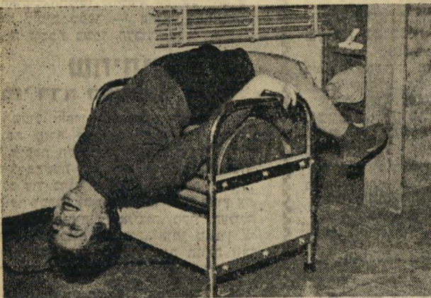
גשר, לשרירי הגב והמתניים עם כל סיבוב של המכשיר.