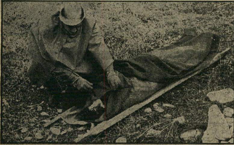
חלל פנחס סירויה בעיה של כובעים

כל רופא ידע להסביר מה גורם להגברתו ולהחלשתו של מחזורי-הדם. כמעט כל כל כלכלן ידע להסביר מה גורם להגברתו של מחזור המטבע. אולם איש לא יוכל להס-