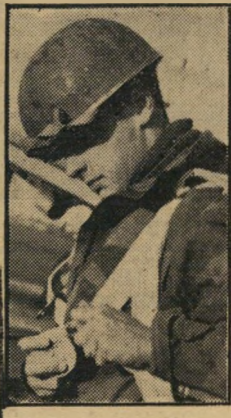
מאת רענן לודיא

לתאר אותה ברפורטג'ה אישית. ולצלם תוך ריחוף באויר תמונות חסרות תקדים של אוירוקרקע בעיני האדם הצונח (עמוד 6) אלה התמונות הראשונות במסגרת מסגרת זו שצולמו אי פעם בישראל.