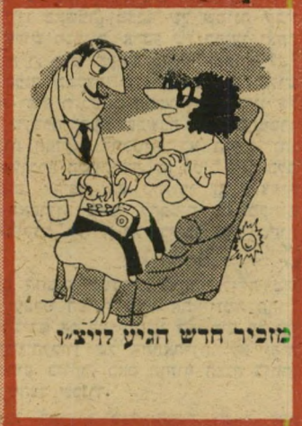
מזכיר חדש הגיע לויצין