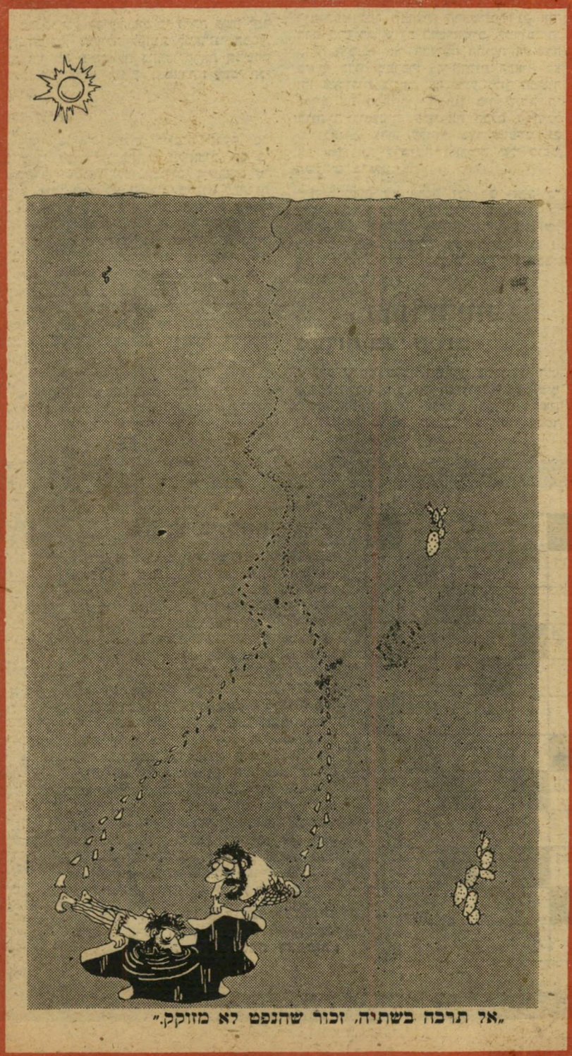
"אל תרבה בשתיה. זכור שהנפס לא מזוקק."