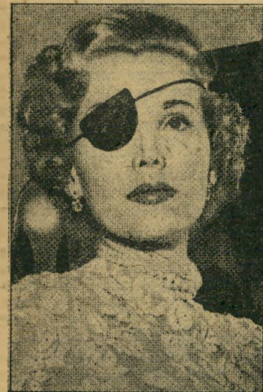
זא-יא גאבור הפצועה בלי מכוחת אין אהפה

יום לפני שנשא פופיריו רובירוה לאשה את מלכת-החיות הפרוטות ברברה האטון, הכריזה הכוכבת ילודת-הונגריה זא-יא (מולין רוג') גאבור, המפורסמת בשערה ה- בלונדי (הצבוע?) כי החתן עסק עד יום לפני נישואיו (הרביעיים) בחיזור נלהב ביר- תן אחיה, ביקש את ידה בו ביום. כש סירבה, הנחית לדבריה הדוך-יואן המפורסם מהלומה הראויה להתכבד על עיניה הימנית, הלך לבקש את יד כלתו העשירה (גנישוואיה, הפעם, היו הרביעיים), לא נואש גם אחרי נישואיו, חיזר אחריה באמצעות שיחות טל- פוניות וזרי פרחים שנשלחו טלגרפית. אמרה זא-יא, במבטאה ההונגרי הטפוס: "העוב- דה שהיכה אותי, עוד לא אומרת שאינו אוהב אותי, אשה שמעולם לא הוכחה, סימן שמי עולם לא נאהפה. אני אוהפת את ג'ורג', סאנדרה, (כוכב הקולנוע, בעלה הנוכחי),