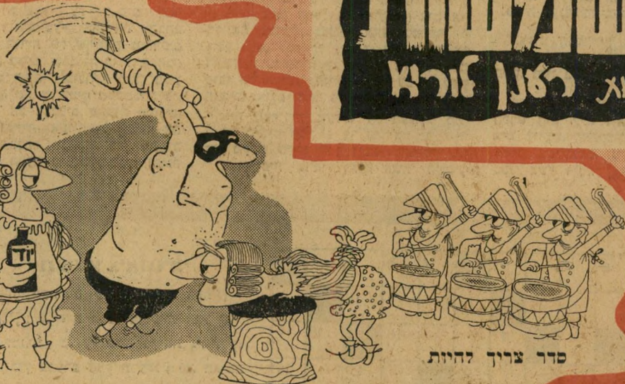
"סדר צריך להיות"