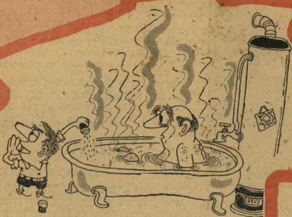
"אמא! ... אמא! ... אני מכין הפתעה לארוחת-צהרים!"