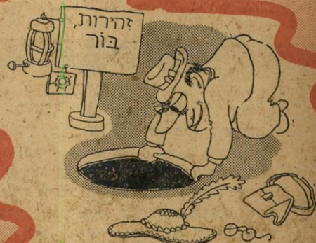
"אכידה בלתי חוזרת"