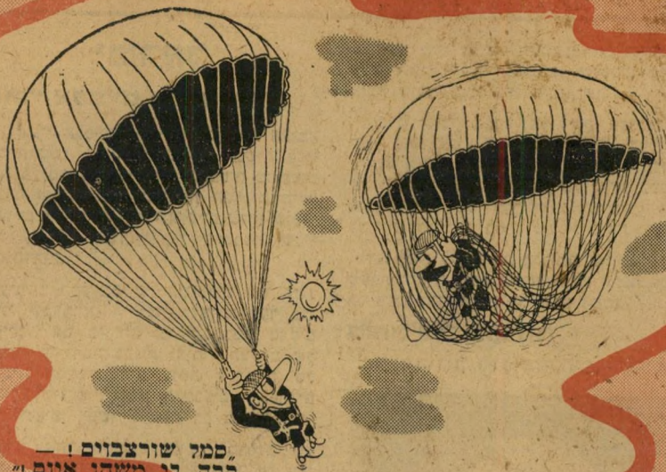
"סמל שורצבוים - קרה לי משהו אימים"